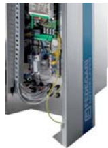
FVS - Stainless steel removable paneling FVS - Pannellatura removibile in acciaio inossidabile