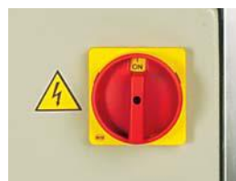
FVG - Main switch for emergency stop FVG - Interruttore principale per emergenza