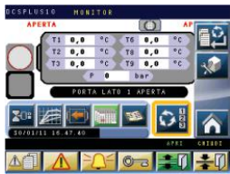
DCS PLUS 10 process controller Controllore di processo DCS PLUS 10