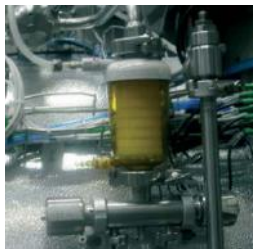
Decontamination of exhaust air with sterile filter / Decontaminazione dell'aria di scarico con filtro sterile